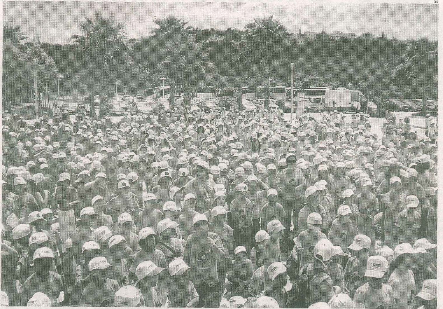
Encontro Desportivo Escola Activa em Silves 2010

No ano lectivo de 2009/2010 houve um crescimento significativo,